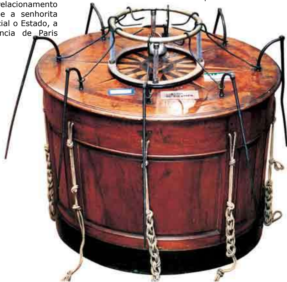
Baquet de Mesmer

Franz Anton Mesmer nasceu na aldeia de Iznang, na Áustria, em 1734 e desencarnou em 1815.